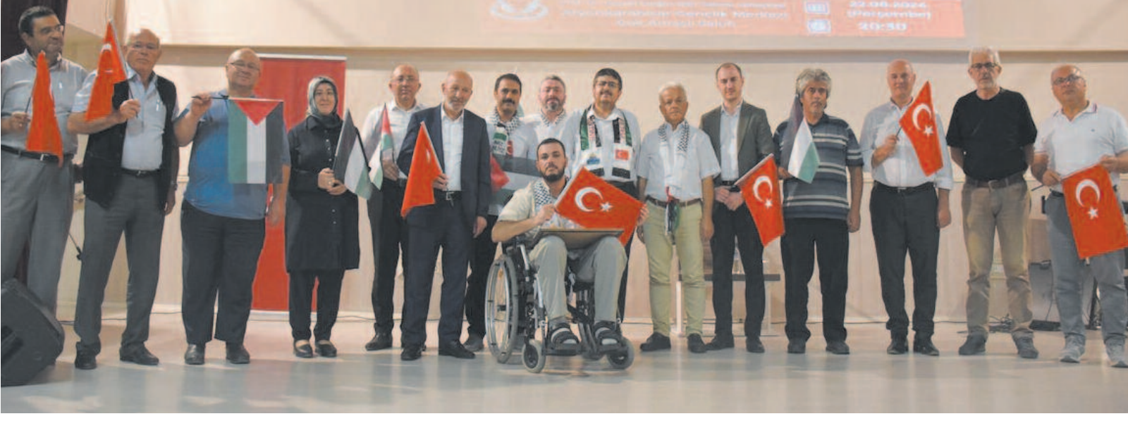
Video gösterimi sırasında, katılımcılar arasında duygusal anlar yaşandı. Birçok kişi, gösterilen görüntüler karşısında derin bir üzüntü hissetti. Etkinlikte bulunan gençler, bu tür görsellerin farkındalık yaratmada ne kadar etkili olduğunu belirterek, daha fazla bilgilendirme ve yardım çağrısında bulundu