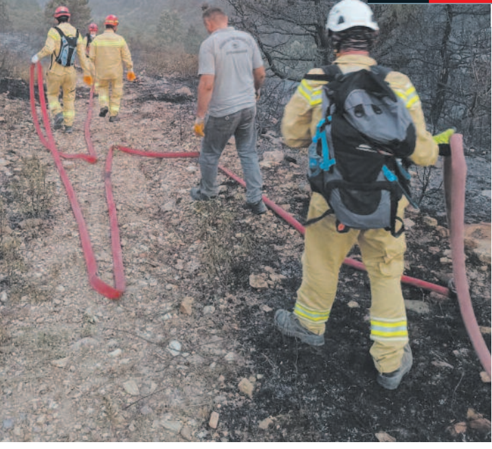
AKUT'tan yapılan açıklamada, "Ekibimiz ardından Ege Bölgesi'nde süren orman yangınları kapsamında Aydın'ın Bozdoğan ilçesinde devam eden orman yangınlarına müdahale için bölgeye gitmiştir" dedi.

A KUT Yönetiminde yapılan açıklamada, "Son haftalarda iklim değişiklikleri, mevsim normallerinin üzerinde seyreden sıcaklıklar ve maalesef ihmale dayalı insan kaynaklı olarak ege bölgesinde hakim olan orman yangınları hepimizi derinden üzmekte ve endişelendirmektedir. AKUT Arama Kurtarma Derneği Afyonkarahisar ekibi gönüllüleri olarak her daim doğal afetler, kaza ve kayıp vakaları karşısında hazır olmak adına eğitimler alıyoruz. Bu kapsamda gönüllülerimizin orman yangınları konusunda da almış olduğu eğitimler sonucunda orman yangınlarına eğitilmiş, donanımlı personeller olarak müdahale ediyoruz. Afyonkarahisar ilinde meydana gelen orman yangınlarına müdahale çalışmasına katılan ekibimiz 5 günde 4 orman yangını operasyonuna çıkarak bu alandaki bilgisini ve tecrübesini ortaya koymuştur. Öncelikli olarak hafta sonu başlayan ve şehrimizin çeşitli yerlerinde etkili olan orman yangınlarına müdahale eden ekibimiz ardından Ege Bölgesi'nde süren orman yangınları kapsamında Aydın'ın Bozdoğan ilçesinde devam eden orman yangınlarına müdahale için bölgeye gitmiştir" dedi.