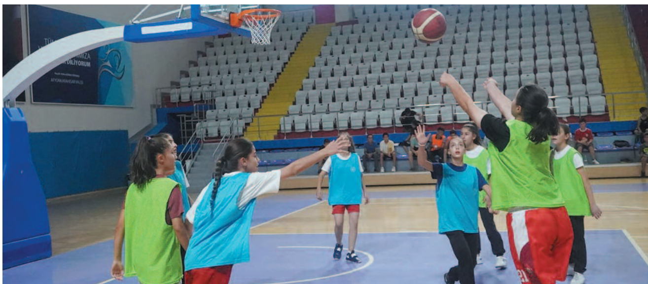
Kasapoğlu ayrıca, GSB Spor Okulları'nın ücretsiz olması nedeniyle tüm ailelere ulaşabildiğini ve bu sayede spora olan ilginin her geçen gün arttığını belirtti

Katılımcılar, sahada sergiledikleri hırs, disiplin ve takım çalışması ile izleyicilerin büyük beğenisini kazandı. Özellikle 12-16 yaş grubundaki sporcuların sergilediği performanslar, yeteneklerin doğru yönlendirilmesi halinde Afyonkarahisar'ın basketbol alanında güçlü bir altyapıya sahip olabileceğini gösterdi.