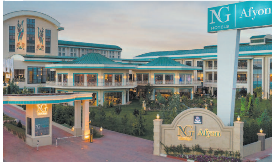
428 odasıyla hizmet veren NG Afyon Hotels'te yüzlerce Afyonkarahisarlı istihdam ediliyor. NG Afyon şehrin yüzakı olmaya devam ediyor. HABER MERKEZİ