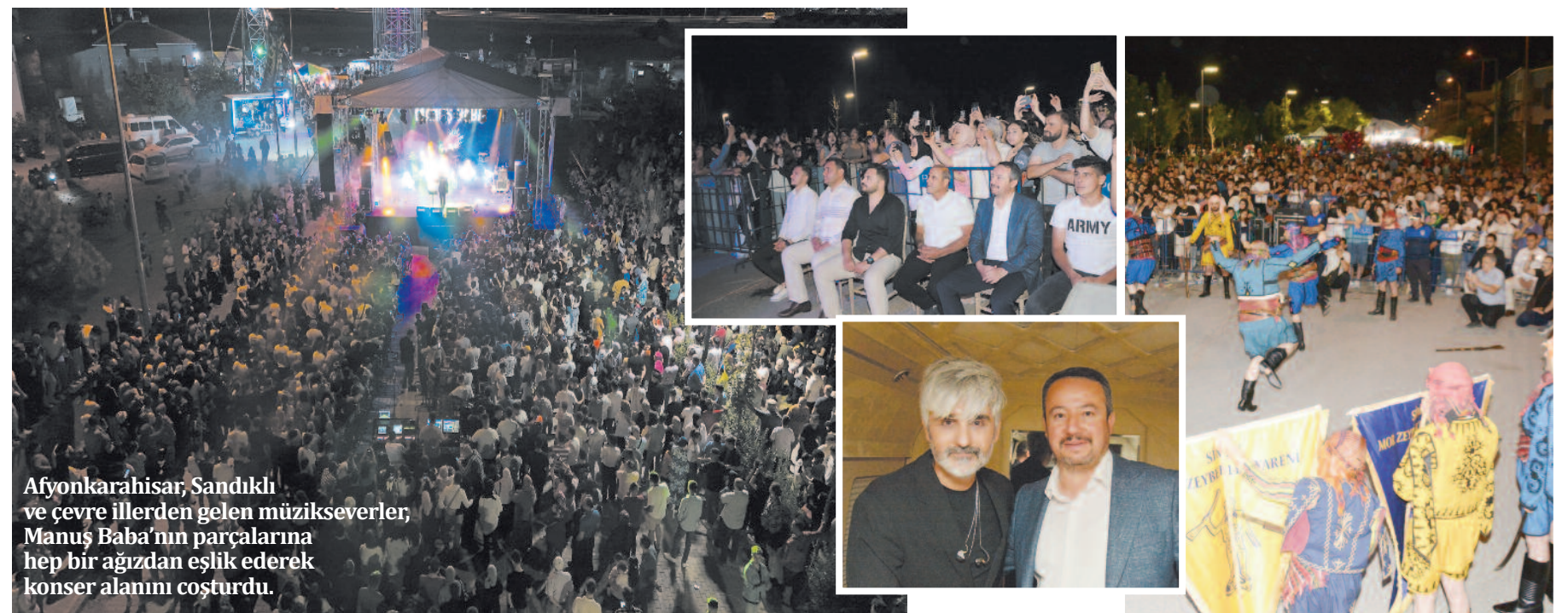
Afyonkarahisar, Sandıklı ve çevre illerden gelen müzikseverler, Manuş Baba'nın parçalarına hep bir ağızdan eşlik ederek konser alanını coşturdu.

Sandıklı Belediyesi'nin geleneksel olarak düzenlediği Termal Turizm ve Gurbetçi Festivali 3. gününde büyük bir coşkuyla devam etti