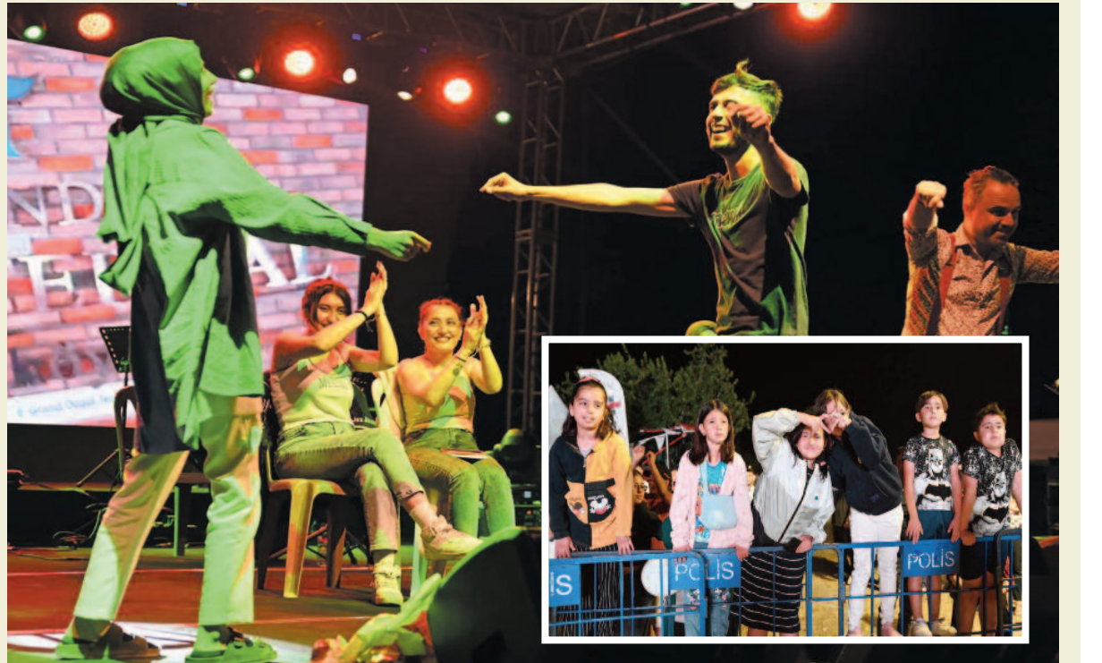
Emirdağ Belediyesi tarafından 17'ncisi düzenlenen Emirdağ Gurbetçi Festivali'nde ünlü sanatçı Uğur Işlak sahnede seslendirdiği türkülerle sevenlerine unutulmaz bir gece yaşattı. HABER CEMİLE KAYTAN