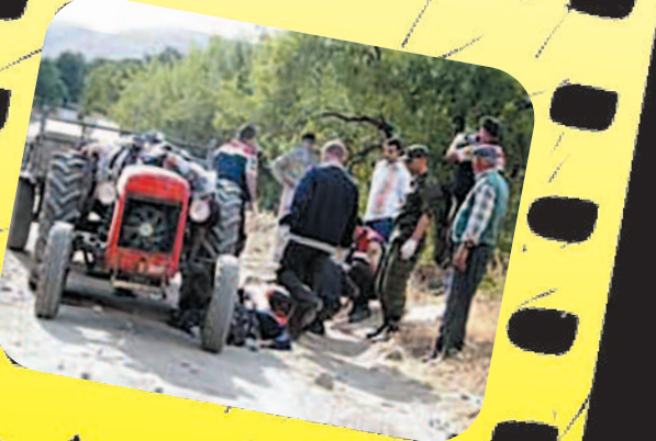
2007 yılı Eylül ayında Şuhut'un Karacaören Beldesi'nde meydana gelen katliam

Kazada 2 kişi yaralandı Takla attı refüje girdi