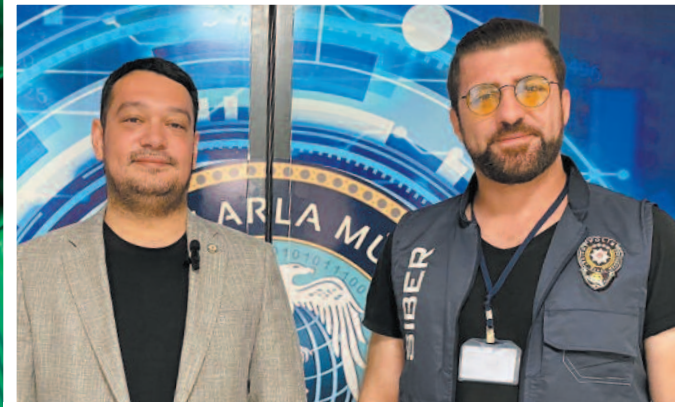
Huzurun teminatı olan ve güvenliğimizin sigortası konumunda bulunan "Siber Suçlarla Mücadele" ekipleri, dikkat çekici açıklamalarda bulundu

Bazen işletmenimizin karşılaştığımız bazı suçlarla, bazı suçlar gözlemleyebiliyoruz. Bunlardan bir tanesi men and the middle attack dediğimiz ortadaki adam saldırıları. Burada özellikle yurt dışına satış yapan firmalarımız ürünü gönderdikten sonra biliyorsunuz Proforma fatura, gönderiyorlar. Bu Proforma faturada ödeme bilgileri oluyor. Zararlı yazılım kullanma suretiyle ya da CO dolandırıcılığı yöntemleri kullanma suretiyle bu Proforma faturadaki İban bilgilerinin değiştirme suretiyle