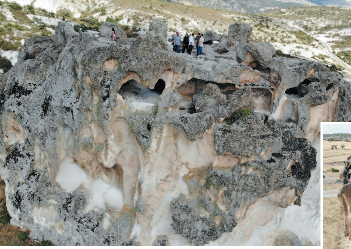
Kalede yer alan yerin dibine doğru 30 derecelik açıyla yapılmış bir tünel bulunmaktadır. Günümüzde yaklaşık 30 m sonrası taşlarla tıkalı olan bu tünelin bir su kuyusu mu yoksa oluşabilecek herhangi bir tehlike durumunda gizli bir geçit mi olduğu gizemini halen koruyor.