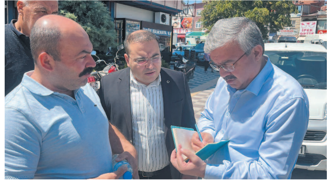
Milletvekili İbrahim Yurdunuseven, ilçe ve köy ziyaretlerine Şuhut ilçesinden başladı. İlk olarak Şuhut İlçe Başkanı Harun Korkmaz'ı ziyaret eden Milletvekili Yurdunuseven, İl Genel Meclis Üyeleri ve Şuhut teşkilatı ile bir araya geldi.