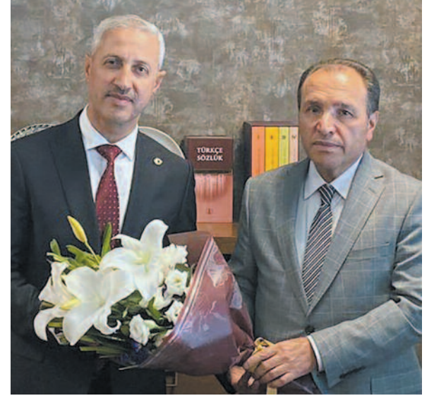
Yükseköğretim Kurulu tarafından belirlenen esas ve usuller kapsamında değerlendirip, yeterli yayın ve çalışmaya sahip olan adaylara doçentlik ünvanı vermek gibi görevleri yer almaktadır. HABER // AHMET İŞİK

2547 Sayılı Yükseköğretim Kanununun 11. maddesi uyarınca üniversiteler üstü bir akademik organ olarak kurulan Üniversitelerarası Kurulun, Üniversitelerin öğretim üyesi ihtiyacını karşılayacak önlemleri teklif etmek, üniversitelerin tümünü ilgilendiren eğitim-öğretim, bilimsel araştırma ve yayım faaliyetleri ile ilgili yönetmelikleri hazırlamak veya görüş bildirmek, aynı veya benzer nitelikteki fakültelerin ya da üniversitelere veya fakülterlere bağlı diğer yükseköğretim kurumlarının eğitim - öğretimine ilişkin ilkeler ve süreler arasında uyum sağlamak, doktora ile ilgili esasları tespit etmek ve yurt dışında yapılan doktoraları, doçentlik ve profesörlük ünvanlarını değerlendirmek, doçentlik başvurularında ilgili bilim veya sanat alanında jüriler oluşturarak adayların yayın ve çalışmalarını