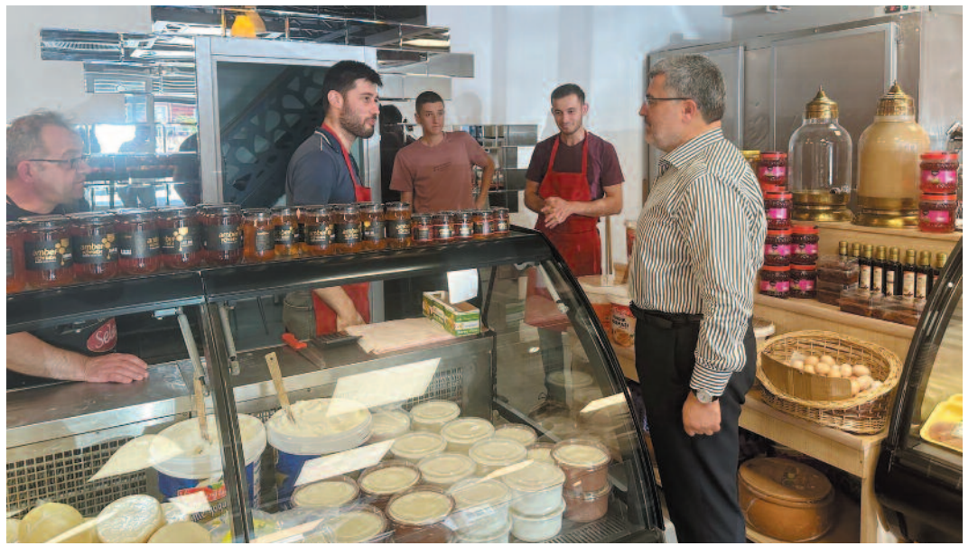
Ziyaretlerinden edindiği gözlemleri de ifade eden Milletvekili Özkaya, "Milletimiz içerisinde bulunduğu durumun yine güçlü iradesi ile liderimiz Cumhurbaşkanımız Sn Recep Tayyip Erdoğan ve AK Parti kadroları ile aşılabacağına inanıyor" dedi