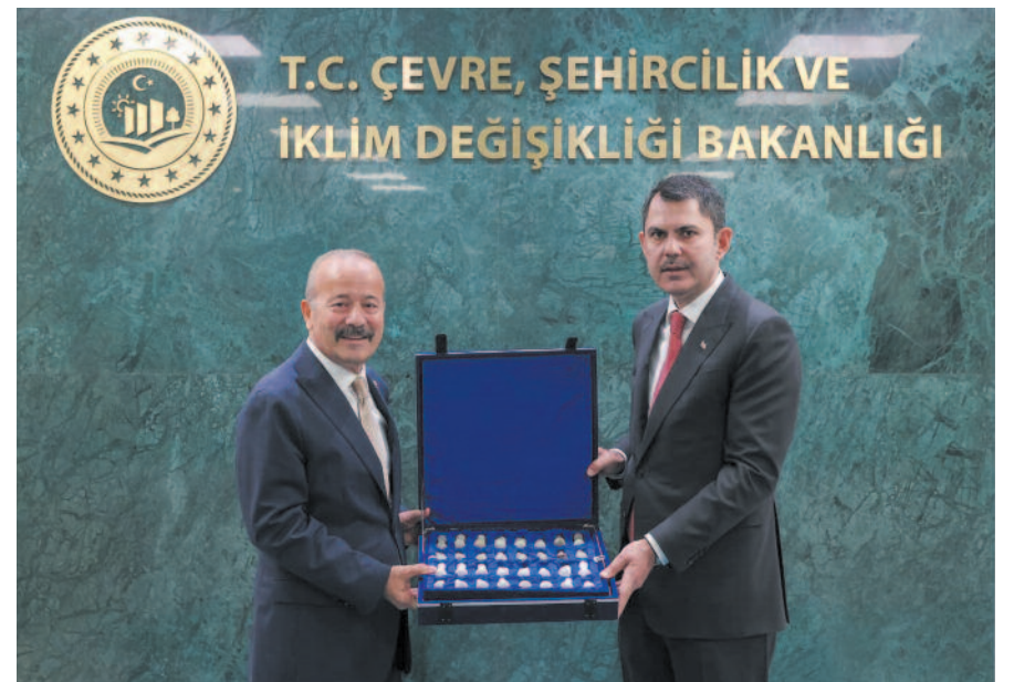
MHP Milletvekili Mehmet Taytak, Afyon'un sorunları ile yakından ilgilenmeye devam ediyor