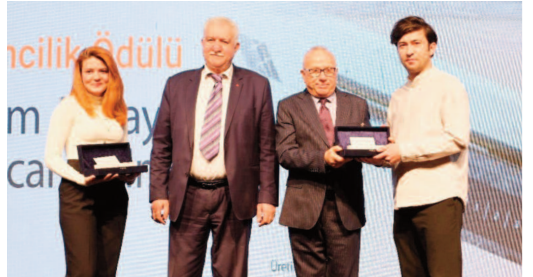
AMORF Doğal Taş Proje ve Tasarım Yarışması'ndaki mola kararında global ekonomide yaşanan daralma temel belirleyici iken ülkemizdeki tasarruf tedbirlerine uyum ihtiyacı da etkili oldu.