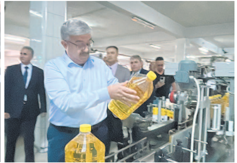
Afyonkarahisar çiftçisi ve üreticisini desteklemek adına Tarım Kredi Kooperatifi tarafından devralınan yap fabrikasının işleyişi hakkında yetkililerden bilgi alan milletvekilleri üretim aşamasını yakından takip ettiler.