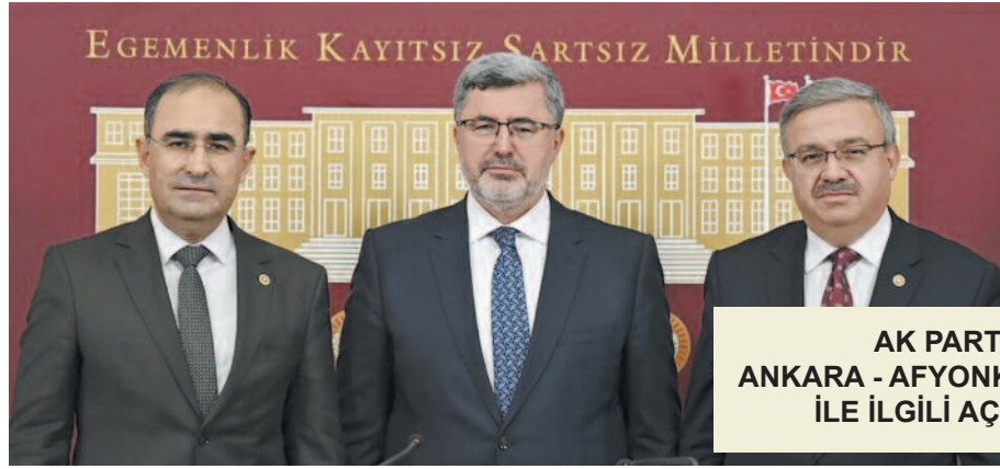
AK PARTİ MİLLETVEKİLLERİ AFRAY VE ANKARA - AFYONKARAHİSAR HIZLI TREN HATTI İLE İLGİLİ AÇIKLAMALARDA BULUNDULAR