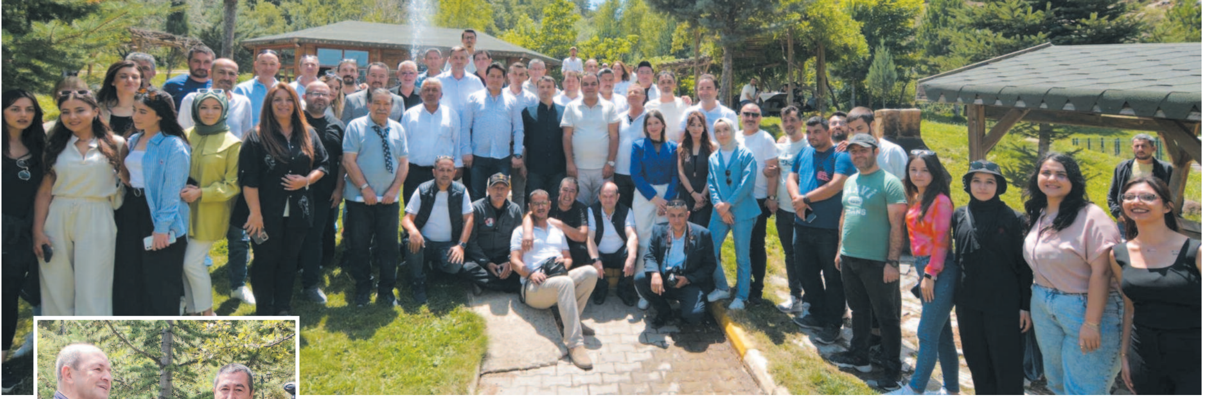
Afyon Gazeteciler Cemiyeti tarafından Taşoluk'ta organize edilen pikniğe basın mensupları aileleri ile birlikte katıldı. Pikniğe katılımın yoğun olduğu gözlemlendi.