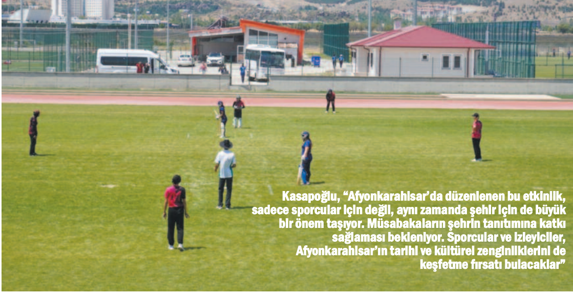
Kasapoğlu, "Afyonkarahisar'da düzenlenen bu etkinlik, sadece sporcular için değil, aynı zamanda şehir için de büyük bir önem taşıyor. Müsabakaların şehrin tanıtımına katkı sağlaması bekleniyor. Sporcular ve izleyiciler, Afyonkarahisar'ın tarihi ve kültürel zenginliklerini de keşfetme fırsatı bulacaklar"