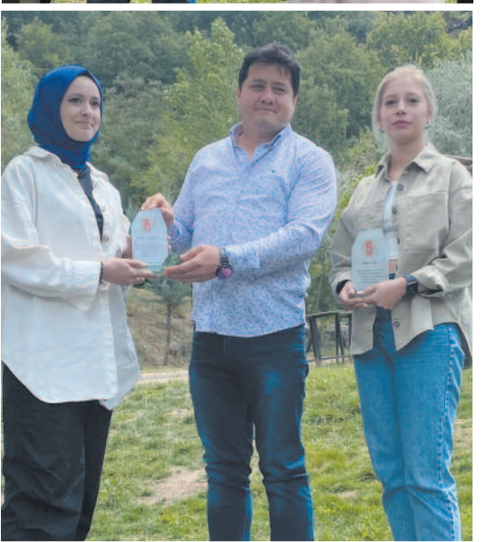
Etkinlikte meslekte 1 ve 2. yılını dolduran basın mensuplarına plaket takdim edildi