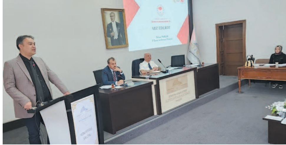
Açılış konuşmalarının ardından havza ölçekli yönetim planları, ulusal ve il su verimliliği planları, taşkın yönetim planları, içme kullanma suyu havza yönetim planları, içme suyu arıtma tesisleri durumu, şebeke kayıpları, modern sulama sisteminde kaydedilen gelişmeler ele alındı.

Afyonkarahisar'da içme ve sulama sularının verimli kullanımı ile kayıp ve kaçakların önlenmesi konusunda toplantı gerçekleştirildi