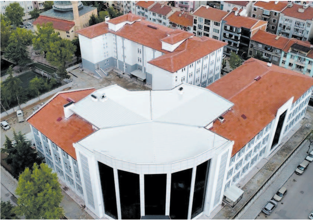
Böylece toplamda 7 okulda çalışmalar eğitim öğretim dönemi tamamlanarak, öğrencilerin hizmetine sunulmuş oldu. Modern ve nezih mimarileri ile öğrencilere daha nitelikli ve daha donanımlı fiziki şartlarda eğitim imkânı sunacak yatırımlar, eğitimdeki kaliteyi de artırmış olacak.