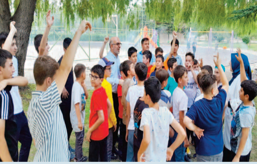
Afyonkarahisar İl Müftülüğü bünyesinde açılan tam gün Yaz Kur'an kursları da devam ediyor.

altyapı sorunlarını çözmek. Belediyemizin mali durumu göz önüne alındığında, 25 milyon Euro gibi büyük bir bütçeyi futbola ayıramayız. Makul bir bütçeyle, kendi öz evlatlarımızla bir futbol takımı oluşturmak istiyoruz" dedi. Bolvadin Belediye Başkanı Aynacı, belediye araçlarına takip cihazları taktırarak, araçların durumunu kontrol altına aldıklarını ve tasarruf sağladıklarını belirtti. "Belediyemizin araçları oldukça yıpranmış durumda. Takip cihazları sayesinde daha etkili bir yönetim sağlıyoruz ve mazot alımında nakit ödeme yaparak tasarruf ediyoruz" dedi ODAK HABER MERKEZİ