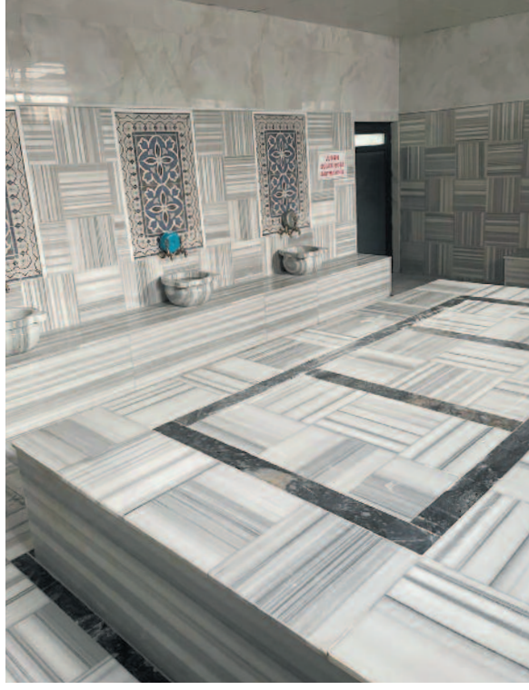
Salı günleri hariç haftanın her günü hizmet verecek olan hamam, geleneksel Türk hamamı konseptiyle tasarlandı.