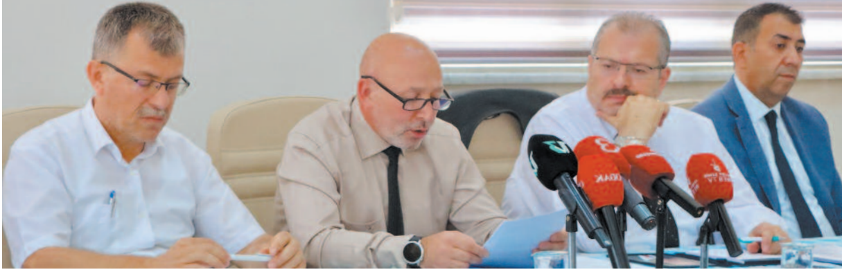
Toplantıya İl Özel İdaresi birim müdürleri ve gazeteciler katıldı. Başkan Siper düzenlediği toplantıda 2024 yılının yatırım programı ilçelere toplamda 184 milyon 133 bin TL aktarıldığını söyledi.

Afyonkarahisar - Dazkırı - Arıköy ve Yukarıyeni köylerinde yağmurlama sulama tesisleri tamamlanmıştır. Tıbbi ve aromatik bitki üretimi, ekoloji değerlendirme raporu hazırlama gibi projeler sürdürülmektedir. 2024 yılı Haziran ayı itibarıyla, Ruhsat ve Denetim Müdürlüğü tarafından toplam 9 adet İşyeri Açma ve Çalışma Ruhsatı verilmiştir. Şu anda toplam 928 adet İşyeri Açma ve Çalışma Ruhsatı yürürlüktedir. 2024 yılı yatırım programı kapsamında ilçelere çeşitli ödenekler gönderilmiştir. Parke 15 milyon TL, Halı Saha, Çok Amaçlı Salon, Köy Konağı: 45 Milyon TL, Milli Eğitim Bakım Onarım 21 Milyon 633 bin TL, İl Genel Yatırım 91 Milyon TL, Gençlik Spor 2 Milyon TL, Sağlık İl Müdürlüğü 2 Milyon 50 TL, Tarım ve Orman İl Müdürlüğü 7,5 Milyon TL, KÖYDES Ödeneği 109 Milyon 865 bin 144 TL. HABER FADİME ÖZKARAN