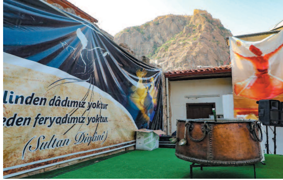
Anadolu'da hâlen önemsenen aşure pişirme geleneği, Mevlevihanelerde de özenle icra edilmiş ve 16. yüzyılda Afyonkarahisar Mevlevihane'sinde (Sultan Divani zamanında) daha renkli törensel bir hüviyet kazandı.

Sınavsız ikinci üniversite ile öğrencilere 39 ön lisans ve 21 lisans programında okuma fırsatı sunuluyor. Öğrenciler 30.000 üzerinde ders malzemesine ücretsiz erişim olanağına sahip oluyor. 81 ilde 110 sınav merkezi ve öğrencilik işlemleri için büro desteği de Anadolu Üniversitesinin öğrencilere sunduğu fırsatlar arasında yer alıyor. İkinci Üniversiteye kayıt yaptırmak isteyen adayların https://aoskayit.anadolu.edu.tr adresinden e-devlet şifresi ile başvuru yapması yeterli oluyor. İkinci Üniversite hakkında detaylı bilgi 7/24 hizmet veren çağrı sisteminden ve http://ikinciuniversite.anadolu.edu.tr/ web sitesinden alınabiliyor. İHA