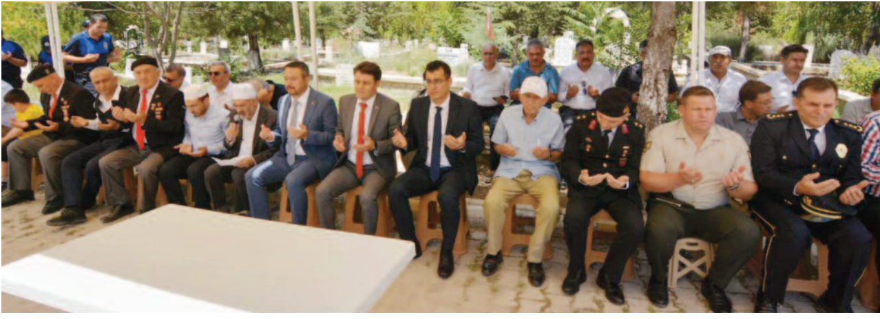
15 Temmuz Demokrasi ve Millî Birlik Günü Programı, Sandıklı Şehir Mezarlığı'ndaki şehitlik ziyareti ile başladı.

Sandıklı İlçesinde 15 Temmuz Demokrasi ve Millî Birlik Günü'nü programı şehitlik ziyareti ile başladı