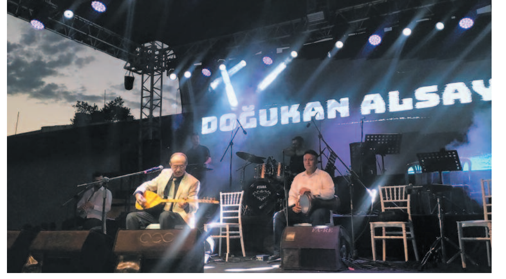
Kartopu, Dokuz yıl aradan sonra tekrar Vişne ve Eber Sarısı Festivali'ni düzenlemenin mutluluğunu yaşadığını belirten Kantartopu, sanatçılara ve tüm vatandaşlara festivale gösterdikleri ilgiden dolayı teşekkür etti.