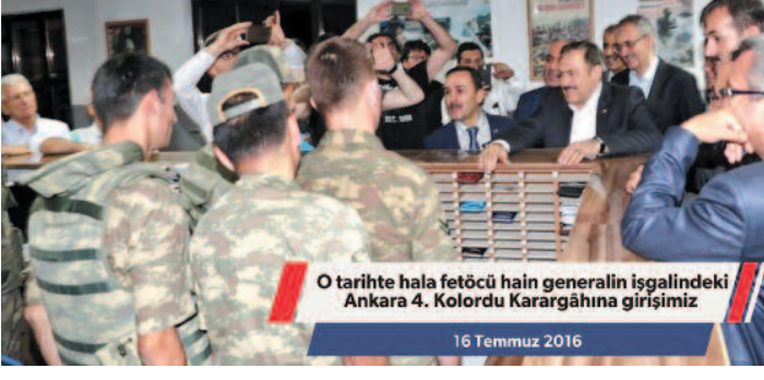
O tarihte hala fetücü hain generalin işgalindeki Ankara 4. Kolordu Karargâhına girişimiz 16 Temmuz 2016