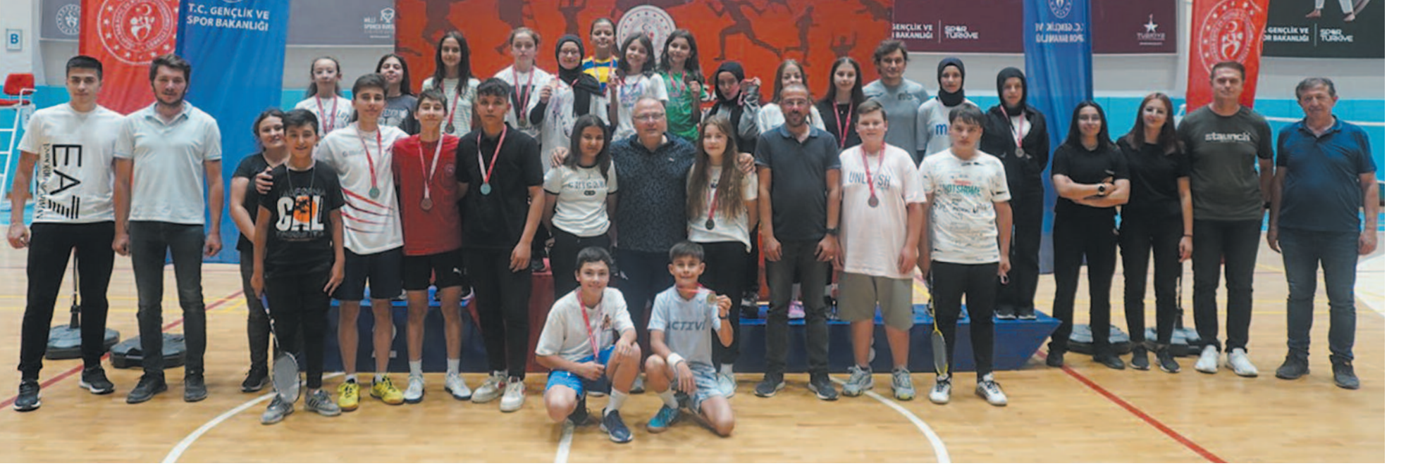
Turnuvada, sporcular küçük kızlar, genç kızlar, genç erkekler, yıldız kızlar ve yıldız erkekler olmak üzere beş farklı kategoride yarıştı.