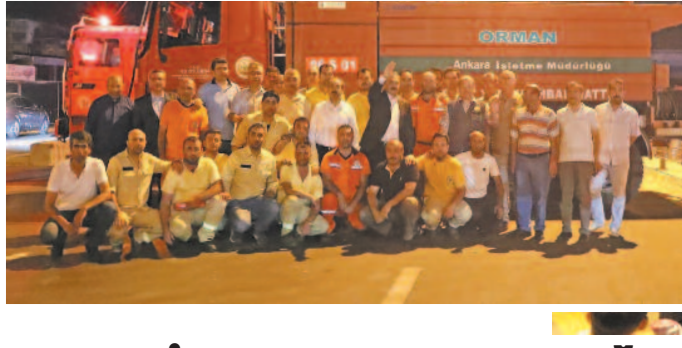
Külliye önünde nöbet bekleyen vatandaşlarımızla buluşma 16 Temmuz 2016