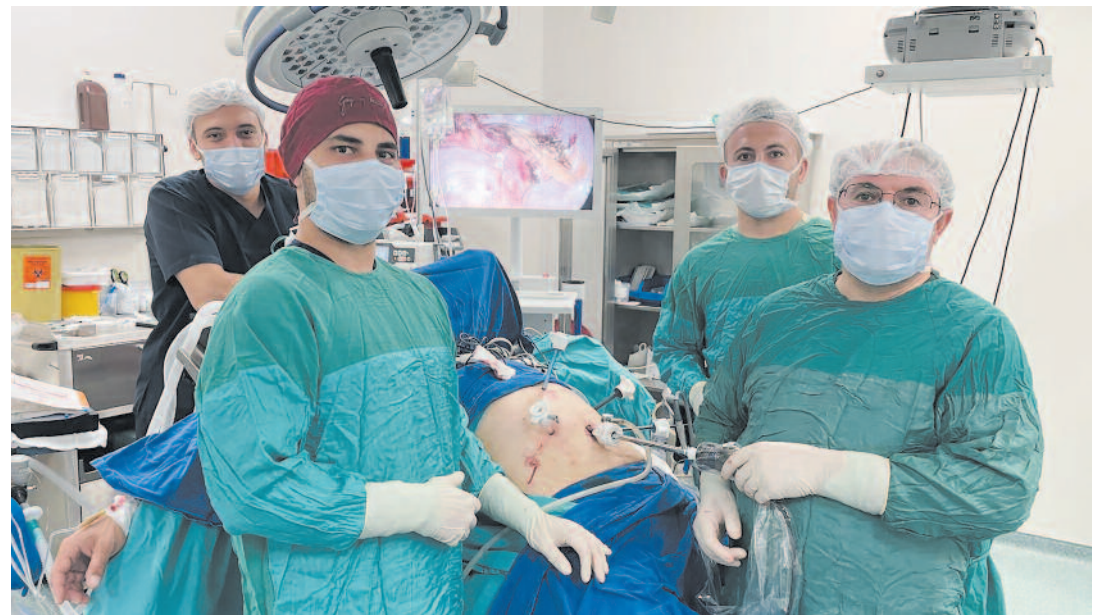
Açıklamada, "Ultrasonografik tetkikte de safra kesesinde çoklu polip tespit edilen hastaya, halk arasında kapalı ameliyat diye bilinen laparoskopik yöntemle mide fitiği tamiri, safra kesesi çıkartılması ve gastrik by pass işlemi uygulandı"

ilçelerinde şifa buldukları için bu imkânları sağlayan yetkililere ve tedavisinde emeği geçen sağlık personeline teşekkür etti. ODAK HABER