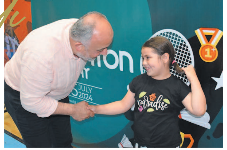
Etkinliğe katılan genç sporcular, Dünya Badminton Günü'nü kutlamanın heyecanını yaşadı. Birçok genç sporcu, bu özel günü bir araya gelerek kutlamaktan büyük mutluluk duyduklarını ifade etti.