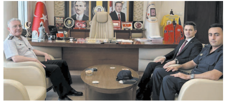
Ziyaret sırasında Başkan Çiçek, belediye olarak ilçede gerçekleştirmeyi planladıkları projeler ve çalışmalar hakkında bilgi verdi.