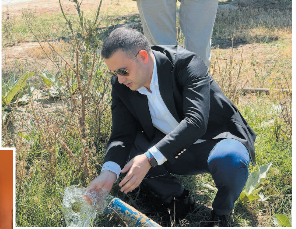
Kaymakam Osman Bilici, Türkmen Akören ve Veysel köyünde bulunan içme suyu kuyularındaki su seviyelerinin tespiti ve mağduriyet yaşanmaması amacıyla yapılacak çalışmaların yerinde inceleyerek, amacıyla köy muhtarları ve yetkililerden bilgiler aldı.