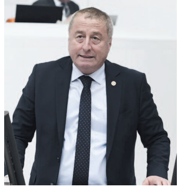
Milletvekili Hakan Şeref Olgun, "Fatura her zaman yaptıkları gibi vatandaşa kesildi ve elektriğe %38 zam yapıldı! Anlayacağınız sarayın bitmek bilmeyen masrafları yine vatandaşımıza yazıldı"