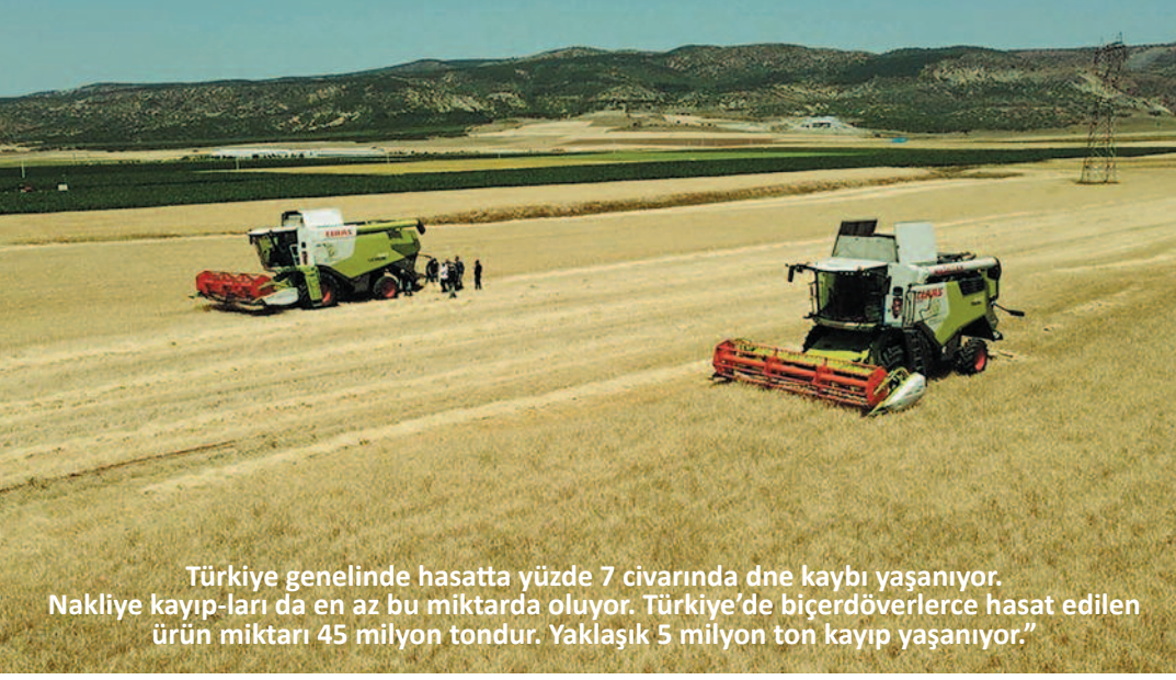
Türkiye genelinde hasatta yüzde 7 civarında dane kaybı yaşanıyor. Nakliye kayıpları da en az bu miktarda oluyor. Türkiye'de biçerdöverlerle hasat edilen ürün miktarı 45 milyon tondur. Yaklaşık 5 milyon ton kayıp yaşanıyor."

Saltık, ülke genelinde 20 binin üzerinde biçerdöverin bulunduğu bilgisini verdi. Türkiye'de genelde babadan oğula geçen biçerdöver operatörlüğünde meslek mensuplarının yetenekli olduğunu dile getiren Saltık, acele yapılan hasattan kaynaklanan dane kayıplarına karşı bazı tedbirler alındığını aktardı. AA