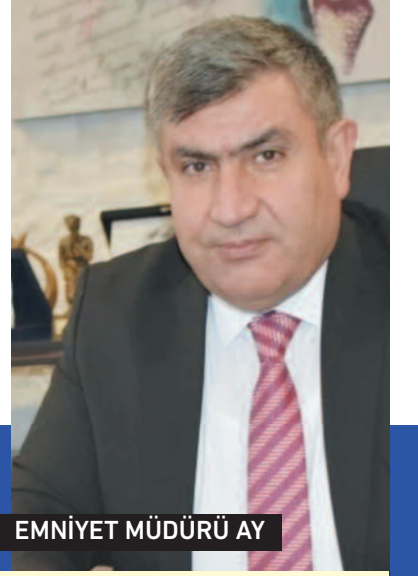
EMNİYET MÜDÜRÜ AY