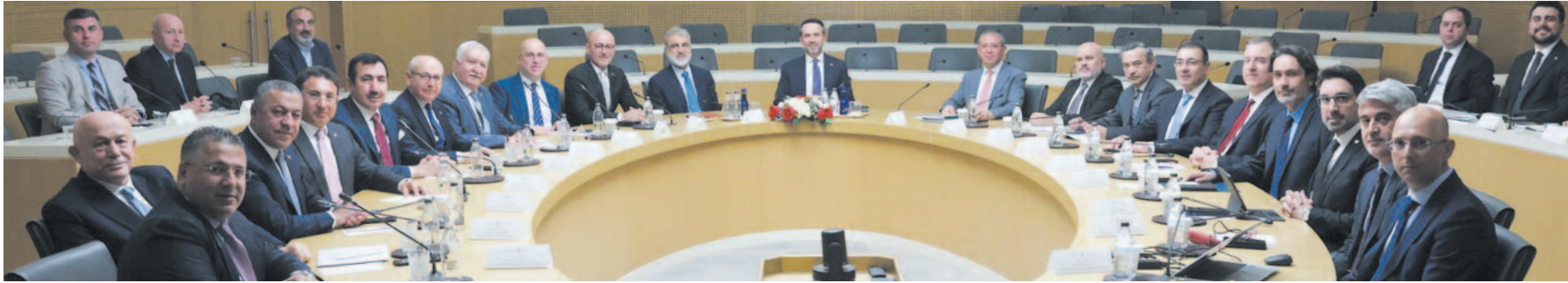
Ege Maden İhracatçıları Birliği'nin güçlü bir şekilde yer aldığı Maden Platformu'nun yoğun mesaisi sektörün ihracat rakamlarına da olumlu yansıyor.

bir toplantı oldu. Maden Platformu olarak her ay düzenli olarak toplanıyor ve sektörün gündemindeki sorunların çözümü için çalışıyoruz" diye konuştu. HABER ALİ OSMAN OKŞAR