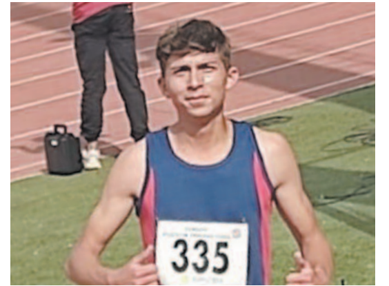
Türkiye'nin dört bir yanından gelen yetenekli sporcuların katılımıyla gerçekleştirildi. İzmir'deki müsabakalarda sporcular, yeteneklerini sergileyerek milli takıma seçilme imkanı elde etmeye çalıştı.