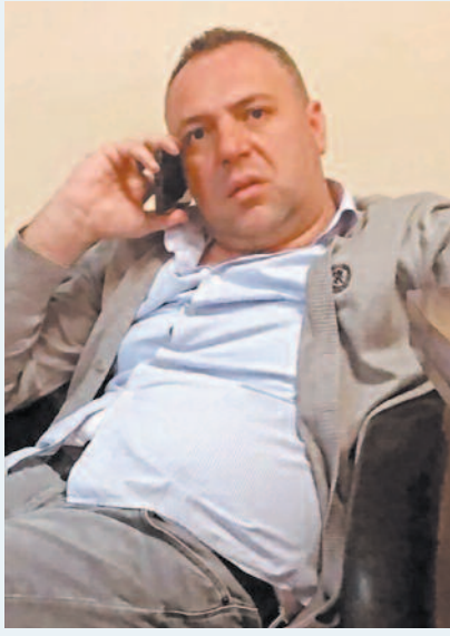
S.B. defalarca bıçaklanarak öldürüldü

Afyonkarahisar'da Park Afyon AVM Rezidanslarında bıçaklı kavga meydana geldi. Kavgada bir şahıs ağabeyini bıçaklayarak hayatını kaybetti