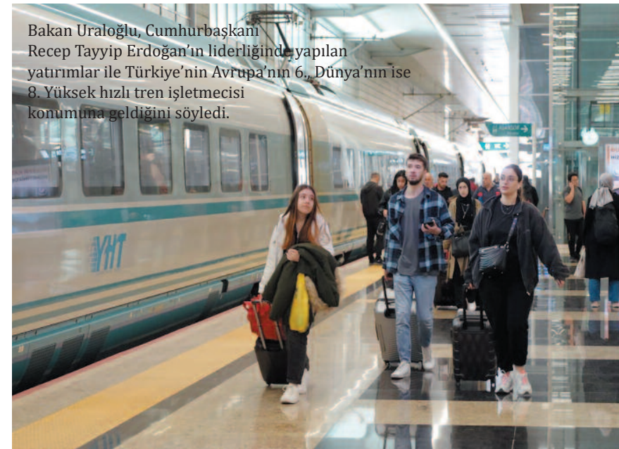
Bakan Uraloğlu, Cumhurbaşkanı Recep Tayyip Erdoğan'ın liderliğinde yapılan yatırımlar ile Türkiye'nin Avrupa'nın 6. Dünya'nın ise 8. Yüksek hızlı tren işletmecisi konumuna geldiğini söyledi.