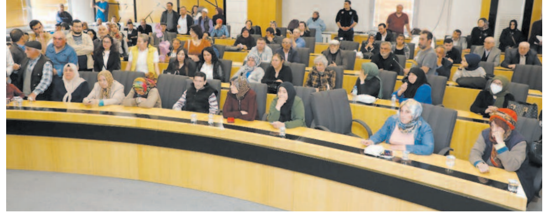
Başkan Köksal'ın açılış konuşmasının ardından söz alan vatandaşlar, istek, talep ve şikâyetlerini paylaştı. Başkan Yardımcıları ve ilgili müdürleri de gelen bu talepleri tek tek not aldı.