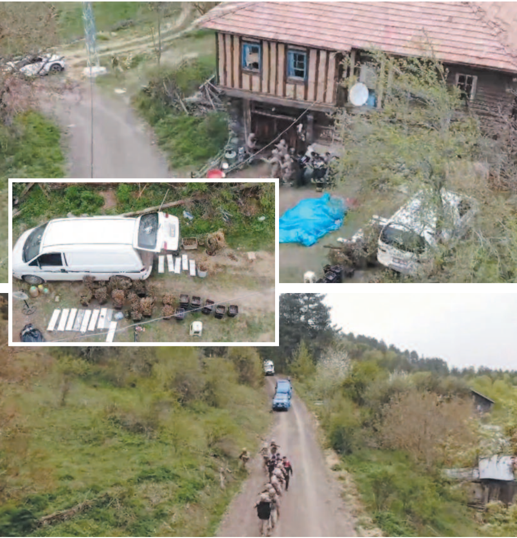
20 ilde operasyonların düzenlendiğini belirten Yerlikaya, 366 şüphelinin yakalandığını, 700 kilogram uyuşturucu madde ve 13 bin adet uyuşturucu hap ele geçirildiğini anlattı.

Afyonkarahisar'ın Dinar ilçesinde polis tarafından durdurulan bir araçta yapılan aramada bin 171 adet uyuşturucu hap ele geçirildi. Edinilen bilgilere göre, Dinar İlçe Emniyet Müdürlüğüne bağlı Narkotik Suçlarla Mücadele Büro Amirliği ekipleri şüphe üzerine bir aracı durdurarak aramam yaptı. Aramada bin 171 adet sentetik ecza diye adlandırılan uyuşturucu hap ele geçirildi. Olay sonrası araçta bulunan M.O. ve A.O., isimli şahısların gözaltına alındığı bildirildi. ODAK HABER MERKEZİ