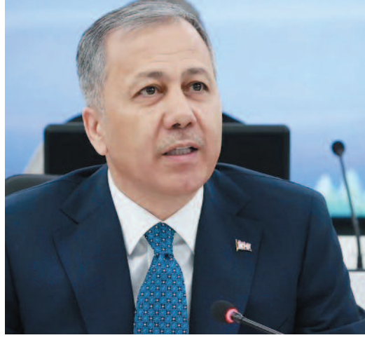
İç İşleri Bakanı Ali Yerlikaya