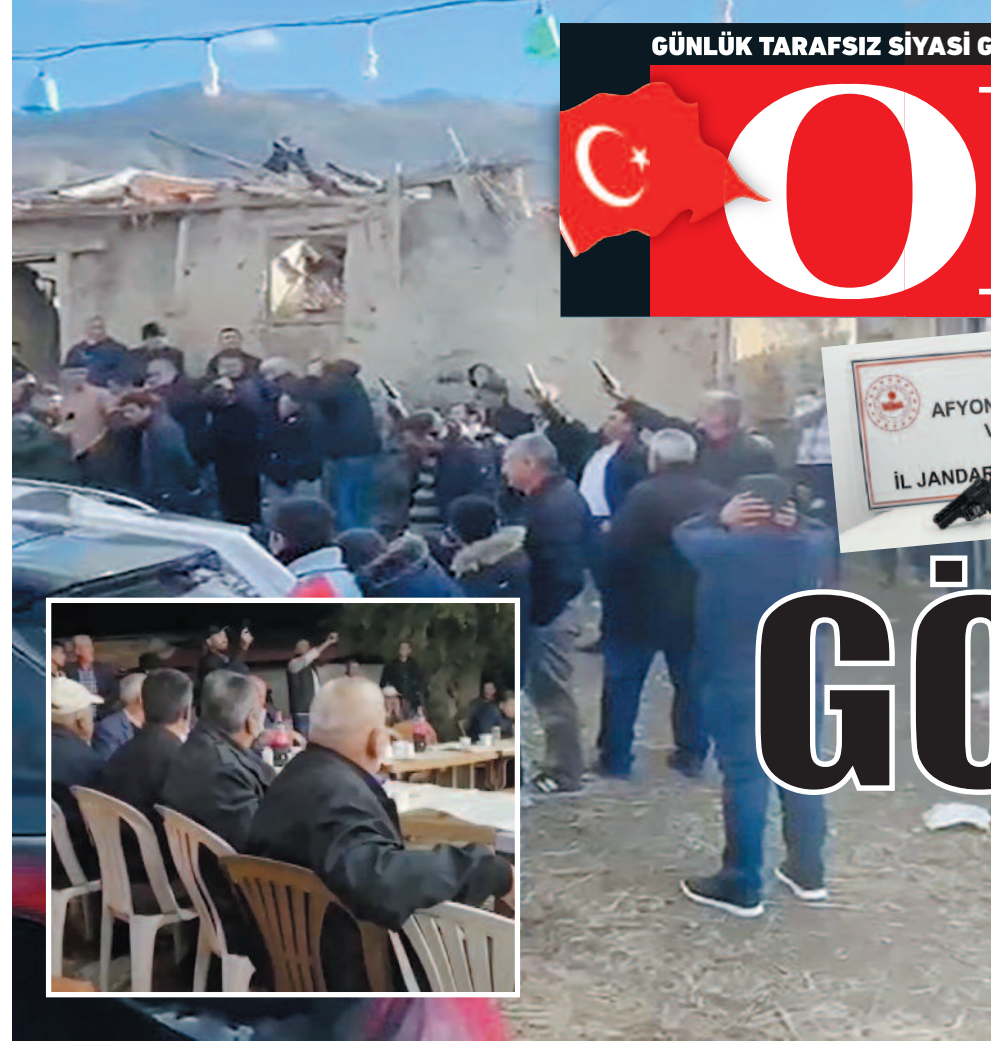
Şahısların adreslerine baskın düzenleyen ekipler 2 adet kurusıkı tabanca ele geçirdi. Olayla ilgili soruşturma sürüyor.