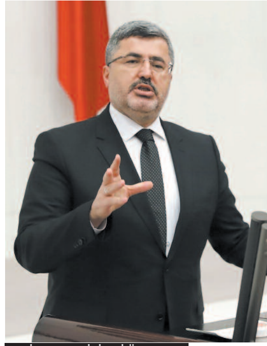
MİLLETVEKİLİ ALİ ÖZKAYA