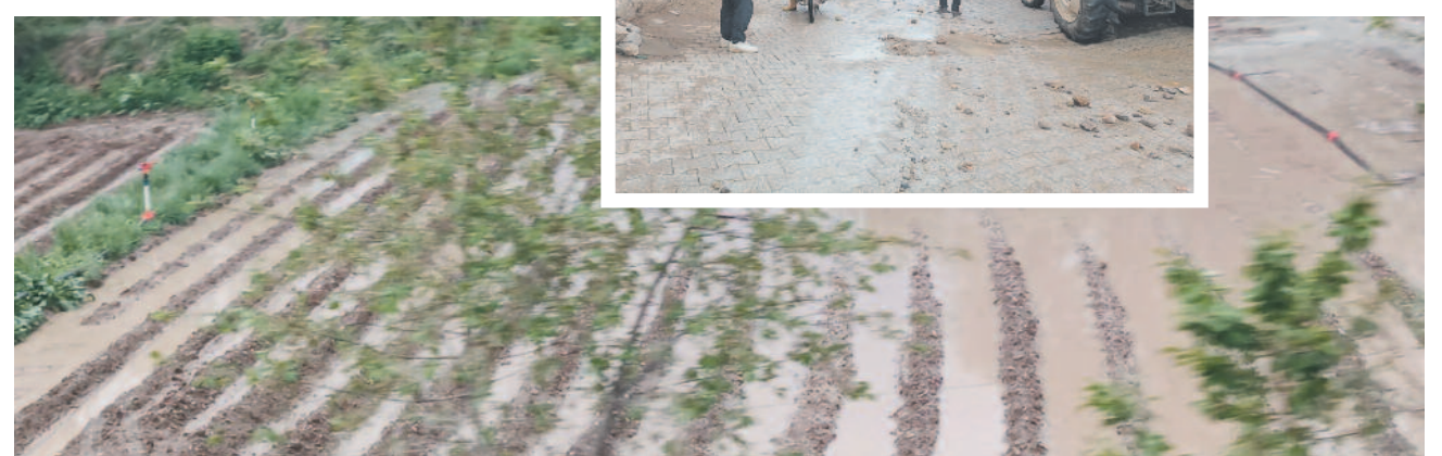
Yolların çamur ve moloz yığına döndüğü köyde İlçe Özel İdaresi ekipleri tarafından temizlik çalışması başlatıldı.