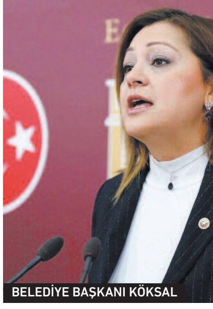
BELEDİYE BAŞKANI KÖKSAL