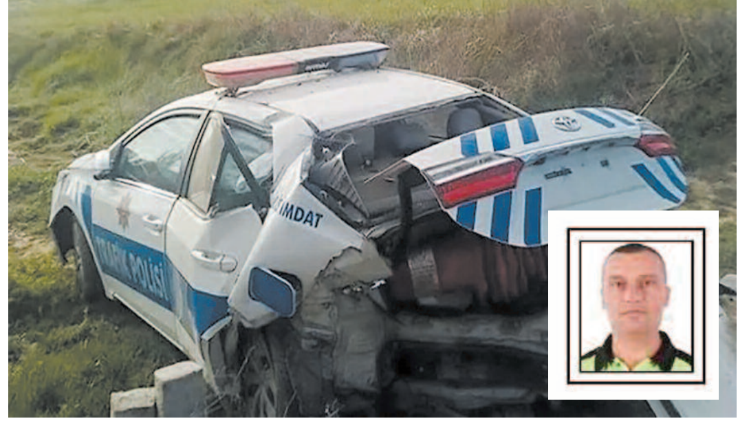
Kazada polis memuru Yonuz Turan ile otomobil sürücüsü İ.A. ve araçta bulunan 3 kişi yaralandı. İhbar üzerine bölgeye ekipler sevk edildi