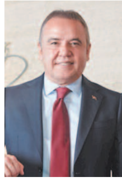
Antalya Büyükşehir Belediye Başkanı Muhittin Böcek

Seçimlerden önce DEM Parti çıkışıyla Türkiye'nin gündemine oturan CHP'li Belediye Başkanı Burcu Köksal'a seçimden hemen sonra Antalya Büyükşehir Belediye Başkanı Muhittin Böcek'ten teşekkür telefonu geldi