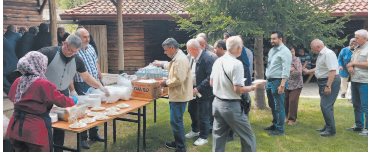
İkramda bulunulan programda Afyonkarahisar Ticaret Lisesi 1980 3-C Mezunları hatıra fotoğrafı çektirerek eski günleri yad ettiler.