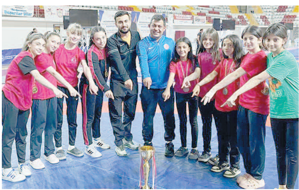
Genç sporcuların bu başarısı, Türk güreşinin geleceği için umut vadediyor. Hem Taşoluk Spor Kulübü'nü hem de Yeşilay Gençlik Spor Kulübü'nü ve madalya kazanan tüm sporcuları tebrik ederiz