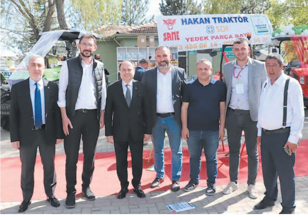
Serteser, "Böyle bir fuar yapılmasından dolayı çok mutlu olduk. Afyonkarahisar Valiliğimiz, Afyonkarahisar Belediyemiz, Afyonkarahisar Ticaret ve Sanayi Odamız, Afyonkarahisar Ticaret Borsamız, tüm kurumlar bu fuarı destekliyor"

Afyonkarahisar, Türkiye tarım ve hayvancılık sektörünün kalbinin attığı bir yer olarak, son derece başarılı bir fuara ev sahipliği yaptı. Bu yıl düzenlenen tarım ve hayvancılık fuarı, 72 firma ve binlerce ziyaretçinin katılımıyla gerçekleşti bölgenin en büyük organizasyonlarından biri olarak tarihe geçti