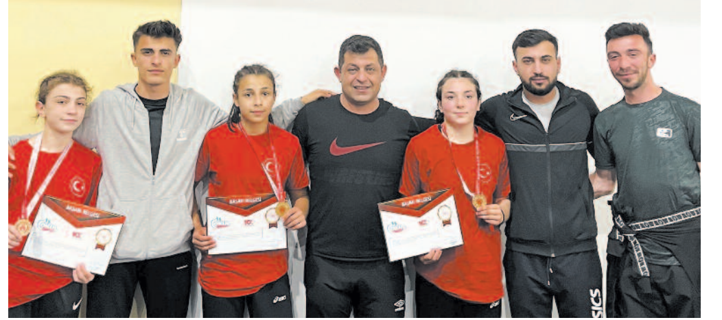
Taşoluk ÇPAL öğrencileri 4 siktette katıldığı Gençler B Güreş Türkiye Şampiyonasında 2 altın bir bronz madalya ile takım halinde ikinci olarak yine zirvede yer aldı.

Genç güreşçilerin bu başarıları, Afyonkarahisar'ın güreş alanındaki potansiyelini ve geleceğe dair umutlarını gözler önüne seriyor.