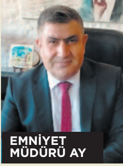
EMNİYET MÜDÜRÜ AY

• Türkiye'nin birçok ilini birbirine bağlayan Afyonkarahisar'da bayram tatili için yola çıkanlar trafik yoğunluğu oluşturdu. İl Emniyet Müdürlüğü Bölge Trafik Müdürlüğü ekipleri ve diğer ekipler trafikte aksama olmaması için yoğun çalıştı. Ayrıntılar 3'te